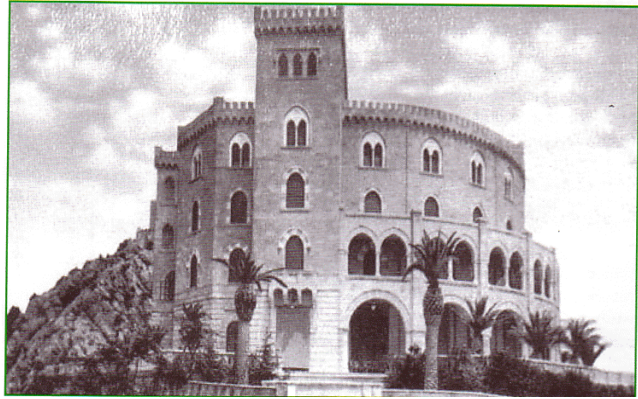
Castello Utveggi: sede del CERISDI

alle tecniche dello sviluppo, allo studio della realtà isolana, ai nuovi rapporti economici da intessere nell'area mediterranea per saldare e valorizzare, come primaria risorsa, una vocazione e un'identità.